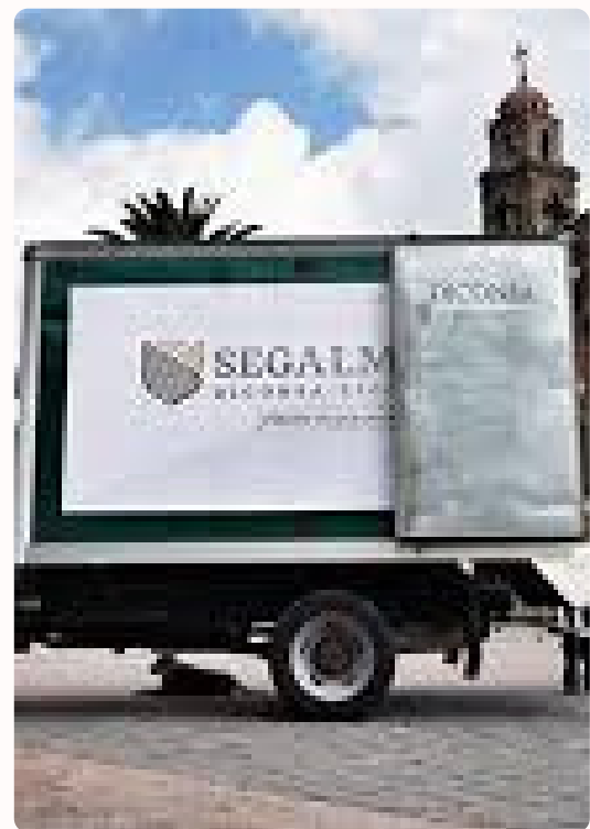
SEGALMEX (Seguridad Alimentaria Mexicana): es una empresa de participación estatal mayoritaria que engloba a Diconsa y Liconsa.

El presidente se limitó a denunciar públicamente, pero sin resultados judiciales contundentes. La narrativa se desgastó: de la promesa de “cero corrupción” se pasó a la justificación de que “ya no hay corrupción arriba”, aunque los datos decían lo contrario.